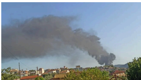
Αγρίνιο: Ένας νεκρός μετά από φωτιά σε εργοτάξιο