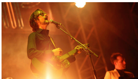
Τα μουσικά ξόρκια του Τζάρβις Κόκερ